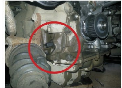
Der Fixierstift mit der OE 303-1054 ist bei der neuen Spannrolle dabei.