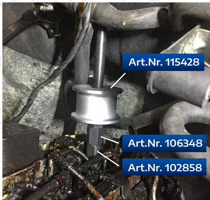
SCHLAGHAMMER MIT ADAPTERN