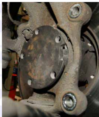
Bild zeigt Artikel 23047 mit Adapter KT10058 (Abzieher für Ford Transit: 106409 mit KT10058)