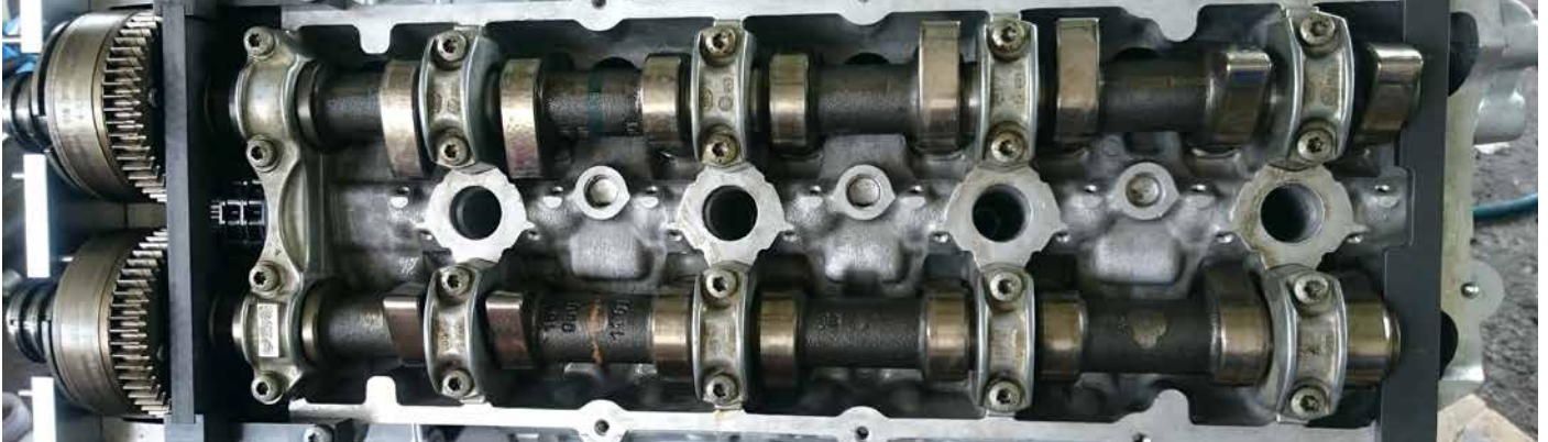
FIXIERWERKZEUG FÜR NOCKENWELLEN