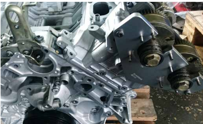
EINSTELLWERKZEUG FÜR NOCKENWELLEN- POSITIONSSENSOR