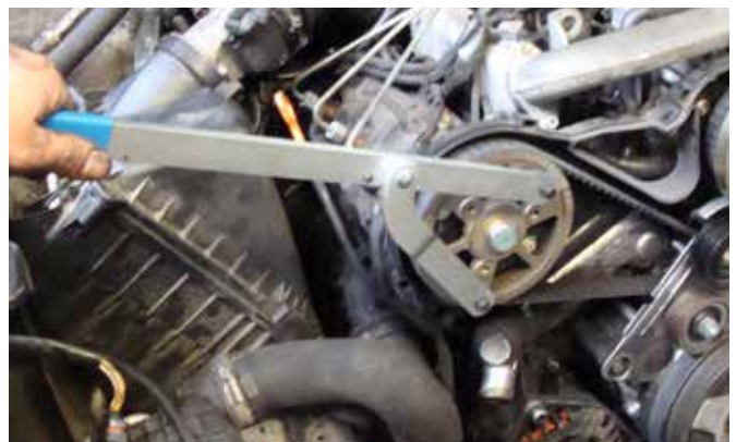
GEGENHALTER FÜR NOCKENWELLENRAD, ART.-NR. 18005