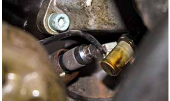
KURBELWELLENARRETIERUNG, ART.-NR. 16023