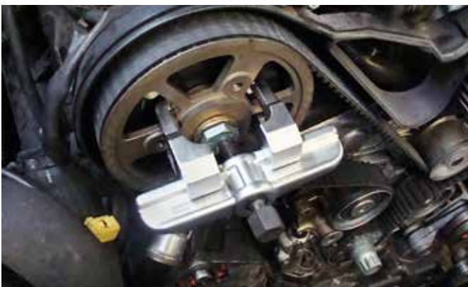
NOCKENWELLENRAD-ABZIEHER, ART.-NR. 12017