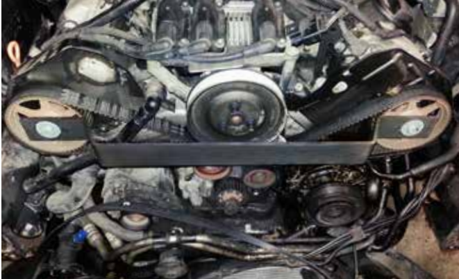
NOCKENWELLENFIXIERUNG, ART.-NR. 16038