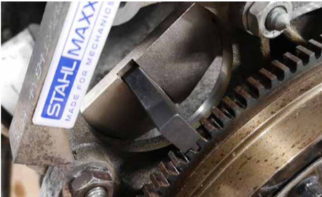
BLOCKIERWERKZEUG FÜR SCHWUNGRAD 50017