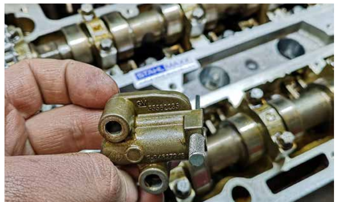
ABSTECKSTIFT FÜR SPANNROLLE 112907