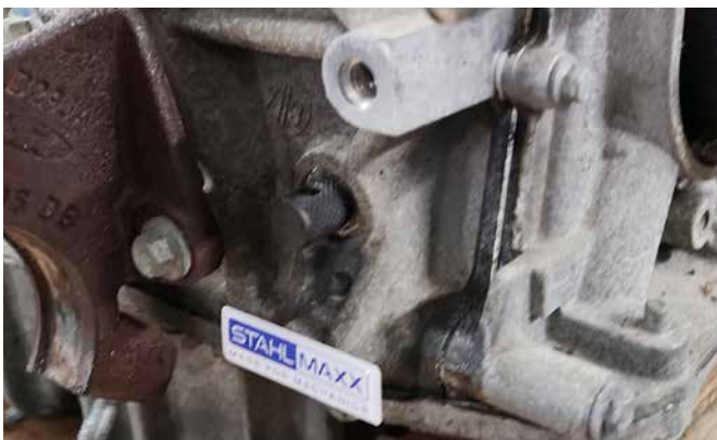
EINSCHRAUBDORN FÜR KURBELWELLE 103678