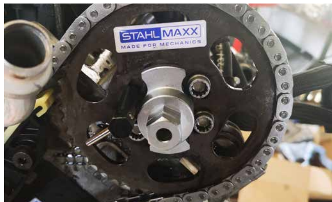
ADAPTER KETTENRADSPANNER & ABSTECKSTIFT