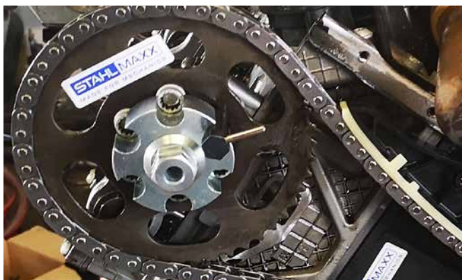
NOCKENWELLENFIXIERUNG & ABSTECKSTIFT