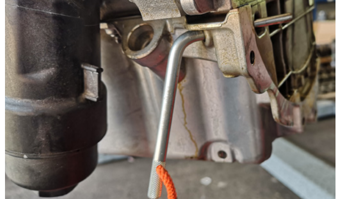
ABSTECKDORN KURBELWELLE / SCHWUNGRAD