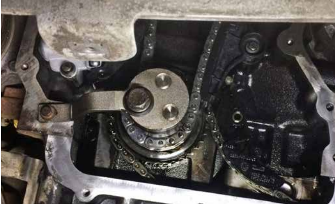
EINSTELLWERKZEUG FÜR KURBELWELLENRAD 106574