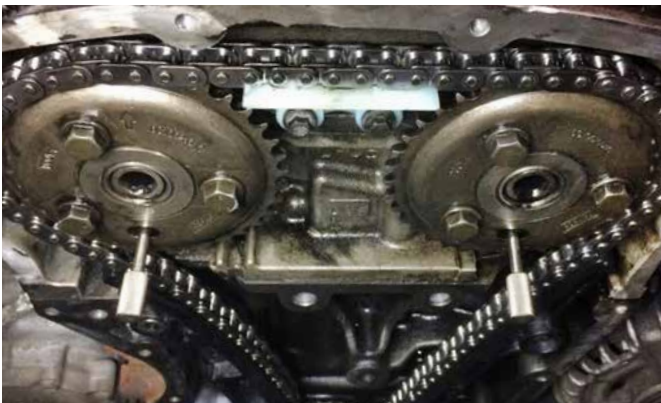
ABSTECKDORN FÜR NOCKENWELLE 121086