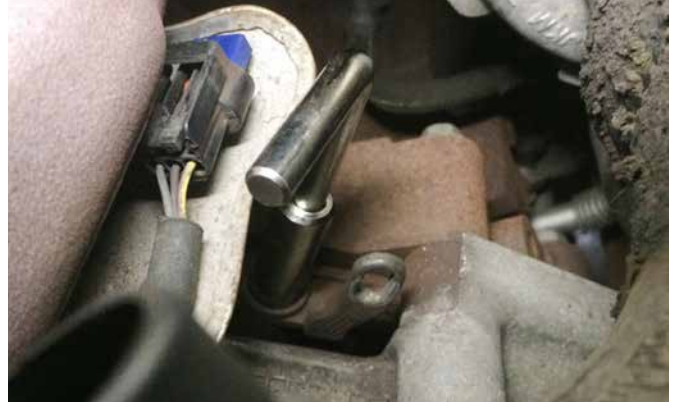
EINSTELLWERKZEUG FÜR KURBELWELLENSCHWUNGRAD 21006