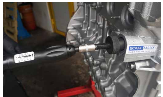
VORSPANNWERKZEUG 118790A UND DREHMOMENTSCHRAUBER 106650