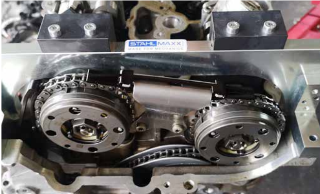
EINSTELLWERKZEUG FÜR NOCKENWELLE 106567