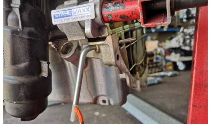
ABSTECKDORN FÜR KURBELWELLE 106568