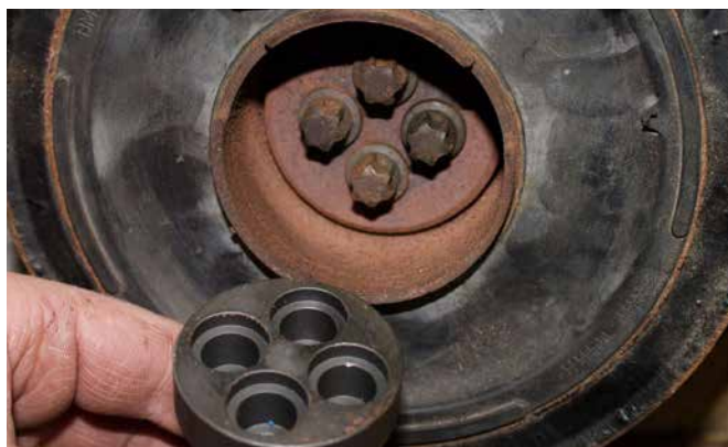
DREHWERKZEUG FÜR KURBELWELLE KT10066