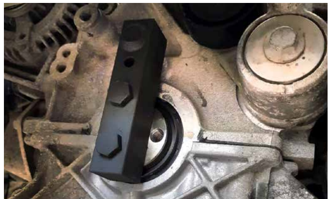
FIXIERUNG FÜR KURBELWELLE 106385