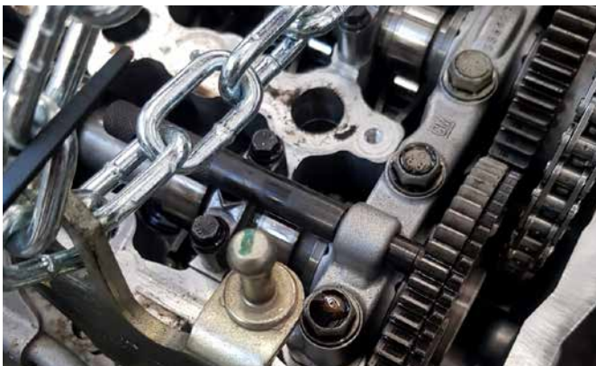
ABSTECKDORN FÜR NOCKENWELLE 106222